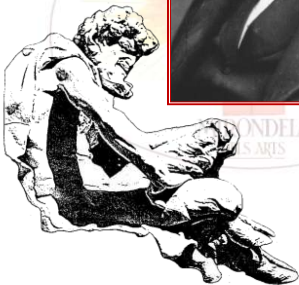
Eugène LABICHE 1815-1888